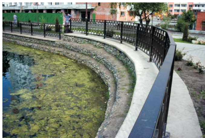
В настоящее время