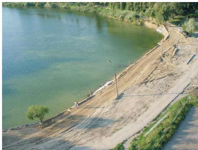
До начала строительства

По завершении строительства участок приобрёл уникальный неповторимый стиль, сочетающий в себе одновременно функциональность и эстетичность габионных сооружений.